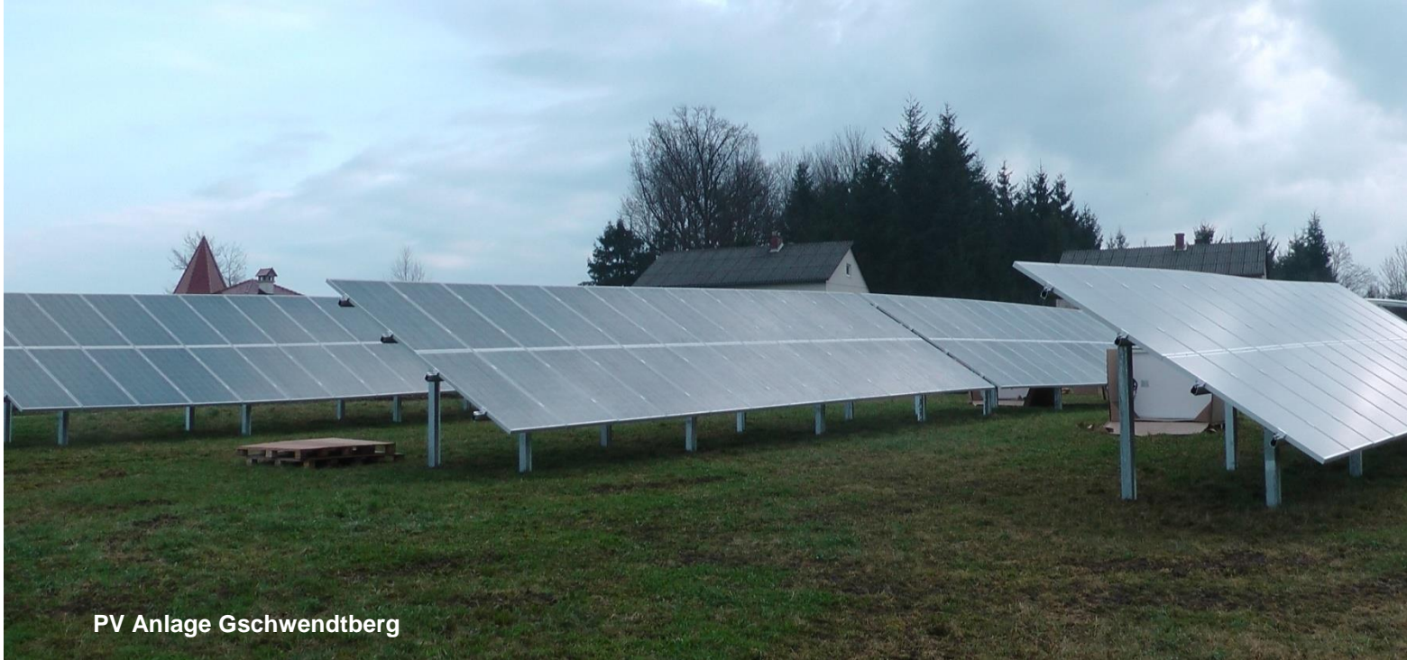
PV Anlage Gschwendtberg